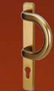
F4 – MADÉLKA